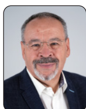
PRÉSIDENT Luc GATEAU