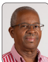
OUTREMER HÉMISPÈRE NORD Henri CAGE